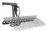
587 93 25-01 Grus- & Ogräsräfsa

Denna "Spiker" gör hål i gräsmattan så att luft och gödning kan tränga ned. Kan tyngas med upp till 32 kg beroende på vilka markförhållanden det är.