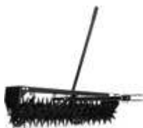
586 63 67-01 Vertikalskärare

snabbare än bakhjulen. Detta justeringsverktyg hjälper dig som återförsäljare att justera hjulhastigheten på alla AWD Riders and P 500-serie maskiner. Kontrollera korrekt hjulhastighet på var modell i verkstadsmanual eller servicebulletin.