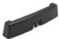
953 53 49-01 Motvikt

Utbytesskär i gummi för ersättningsskär till snöblad. Gummi-skäret är lämplig när det finns ett behov av att skydda marken / underlaget från att bli skadat av metallskäret.