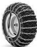
585 66 61-01 Snökedjor —fyrkantiga (par)

16 kg. För ett bättre grepp och säkrare körning.